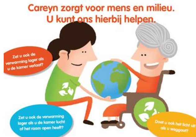
Placemat met duurzame tips: mooi voorbeeld om medewerkers & bewoners bewust te maken

De vierde actie, een quiz met vragen over duurzaamheid, is met enige vertraging in november 2021 uitgevoerd. De quiz is geplaatst in het online medewerkersblad Flits. De quizvragen maken medewerkers ervan bewust dat ze sommige acties thuis wél uitvoeren en op de werkvloer niet, zoals zuinig zijn met water.