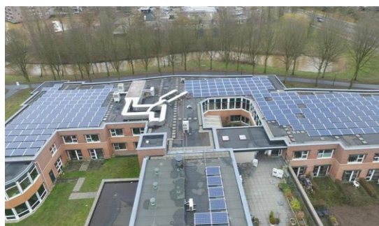
Atlant, verpleeghuis Heemhof

Atlant bestaat uit diverse verpleeghuizen en woonzorgcentra. Ze bieden huisvesting, verzorging, verpleging en begeleiding aan cliënten. Daarnaast maken cliënten die nog zelfstandig wonen ook gebruik van de voorzieningen die Atlant biedt. Atlant is gespecialiseerd in de juiste (verpleeghuis)zorg aan patiënten met Korsakov, Huntington, dementie of CPV (Chronisch Psychiatrische Verpleeghuiszorg). De zorggroep heeft zo'n 1.450 medewerkers (962 fte) en in het begin van 2020 760 vrijwilligers. Op negen locaties binnen de gemeente Apeldoorn ondersteunen zij ruim 900 mensen 24 uur per dag, waarvan iets meer dan 700 intramuraal.